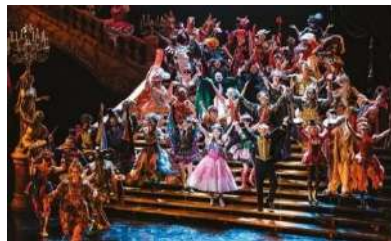
Her Majesty's Theatre

Soirée comédie musicale - The phantom of the opera.