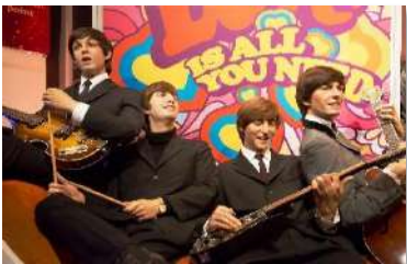
Musée de Mme Tussaud

Quel sera l'artiste choisi par vos élèves ?