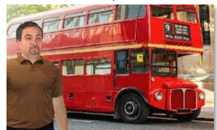
Bus à impériale